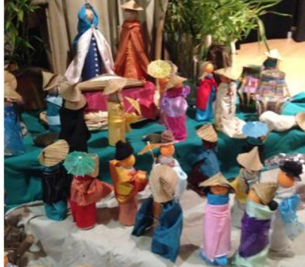
Crèche vietnamienne en l'honneur d'une sœur en visite dans la communauté dominicaine