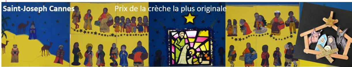
Une crèche-vitrail et de très mignonnes crèches individuelles chez les maternelles