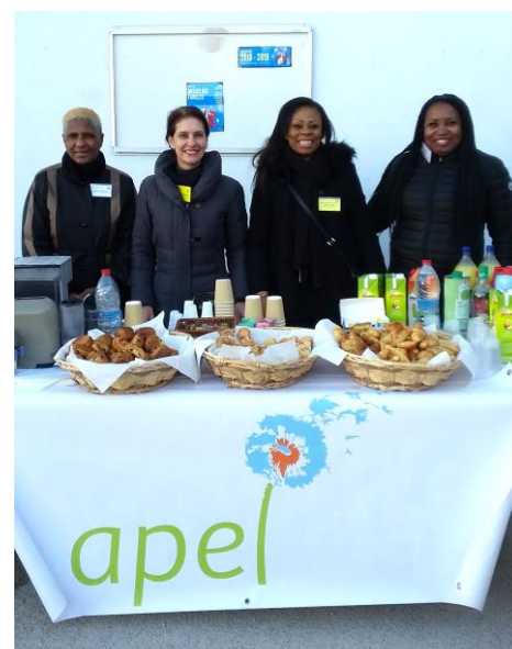
Un accueil chaleureux au collège Saint Philippe Néri malgré le froid extérieur