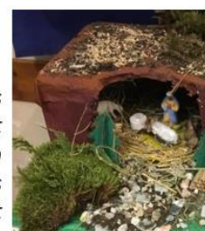
Toutes les classes ont participé à un concours dans l'établissement