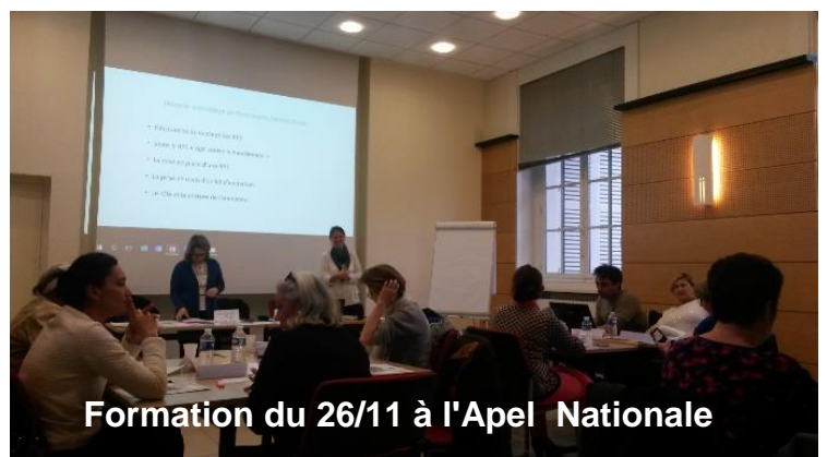
Formation du 26/11 à l'Apel Nationale

L'équipe Apel06 vous souhaite une belle année 2017 !